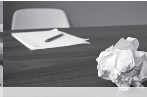
107 Resilienz in der Mediation