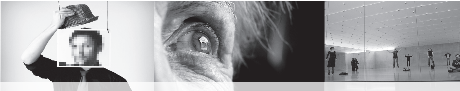
235 Neue Medien und Mediation